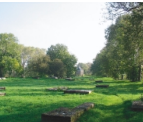
Overzicht van Beth Haim te Ouderkerk aan de Amstel. Hier komen de elementen groen, rood en grijs op harmonieuze wijze samen